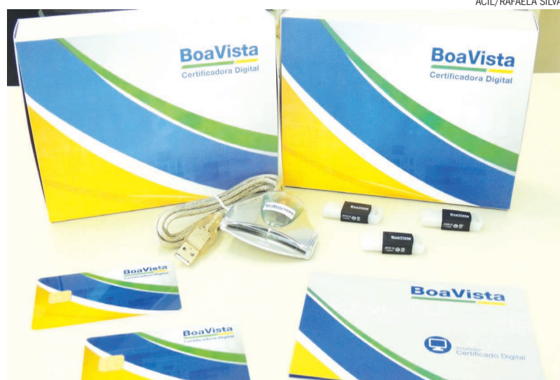
No posto de atendimento da Certificação Digital da ACIL são oferecidos produtos como o e-CPF, e-CNPJ, NF-e e o CT-e

O ano de 2016 começou com uma novidade para as empresas optantes pelo Simples Nacional, com mais de oito funcionários. Desde o dia 1º de janeiro, a categoria deve entregar a GFIP e o e-Social com certificado digital. Dessa forma é importante saber um pouco mais sobre essa ferramenta que auxilia e muito o dia a dia do empresário e que pode ser adquirida no Posto da Certificação Digital da ACIL.