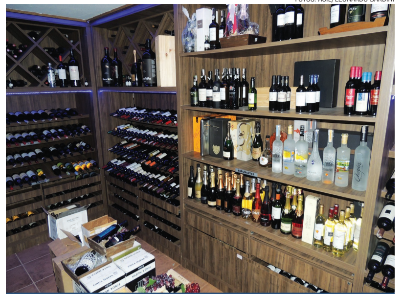
A cartela de vinhos em locais como o Terroá, oferece um vasto número de sabores e marcas para agradar todo tipo de paladar

O cardápio deste tipo de estabelecimento é bem variado, e apresenta pratos que não são encontrados em restaurantes comuns. Cada bistrô difere as receitas oferecidas de acordo com o chef que prepara os pratos. Alguns se especializam em massas, outros em peixes, grelhados, risotos etc. No Terroá, o cardápio apresenta uma grande variedade, destaque para a “Sugestão do Chef”, um prato especial que não consta no cardápio, e é feito de acordo com os ingredientes e criatividade da chef.