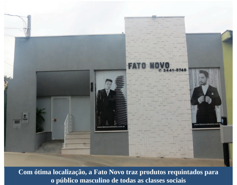
Com ótima localização, a Fato Novo traz produtos requintados para o público masculino de todas as classes sociais