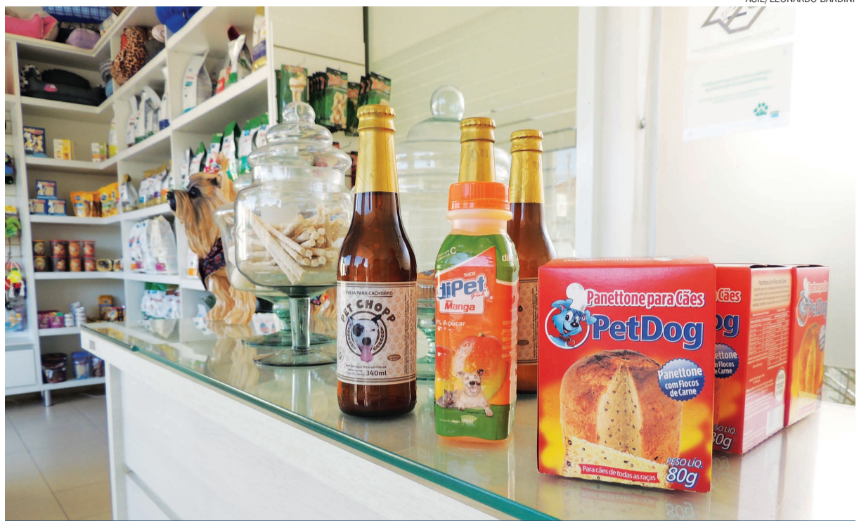
Produtos como panetones, sucos e até cervejas criados exclusivamente para animais, são algumas das novidades do mercado pet

A médica veterinária comenta que na hora de contratar um profissional, seja na parte médica ou estética (como os de banho e tosa), deve-se atentar ao manuseio que será dado ao animal. “Cada espécie necessita de um tipo de tratamento. Um cão de porte grande é muito diferente de um porte pequeno, e um felino necessita de um tratamento diferente do cachorro. É preciso respeitar o limite e o nível de estresse de cada um”, acrescenta.