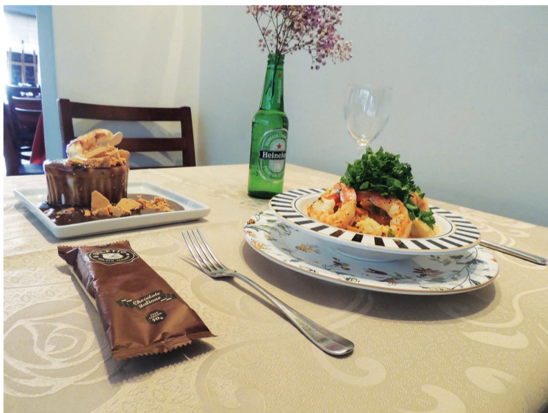
Os bistrôs utilizam ingredientes selecionados e de qualidade, garantindo mais sabor aos pratos

Vários médicos e especialistas indicam o consumo de uma taça de vinho durante a refeição. Além de saboroso, a bebida ajuda no processo digestivo e seu consumo moderado colabora na prevenção de doenças cardiovasculares, pois auxilia na eliminação de radicais livres presentes no sangue, prevenindo o depósito de placas de gordura na parede dos vasos sanguíneos. Porém, sempre deve haver moderação, pois o excesso de qualquer bebida com teor alcoólico pode acarretar transtornos para o organismo.