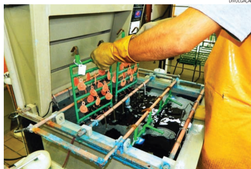
Os fabricantes e importadores terão prazo de 36 meses para se adequarem às novas regras

carga é devolvida ao país de origem, às custas do importador. As multas aplicadas no caso de constatação de irregularidade podem chegar a R$ 500 mil. A multa está ligada à quantidade de produto irregular e à reincidência. “Importador, fabricante ou comerciante reincidente, o valor da multa aumenta”.