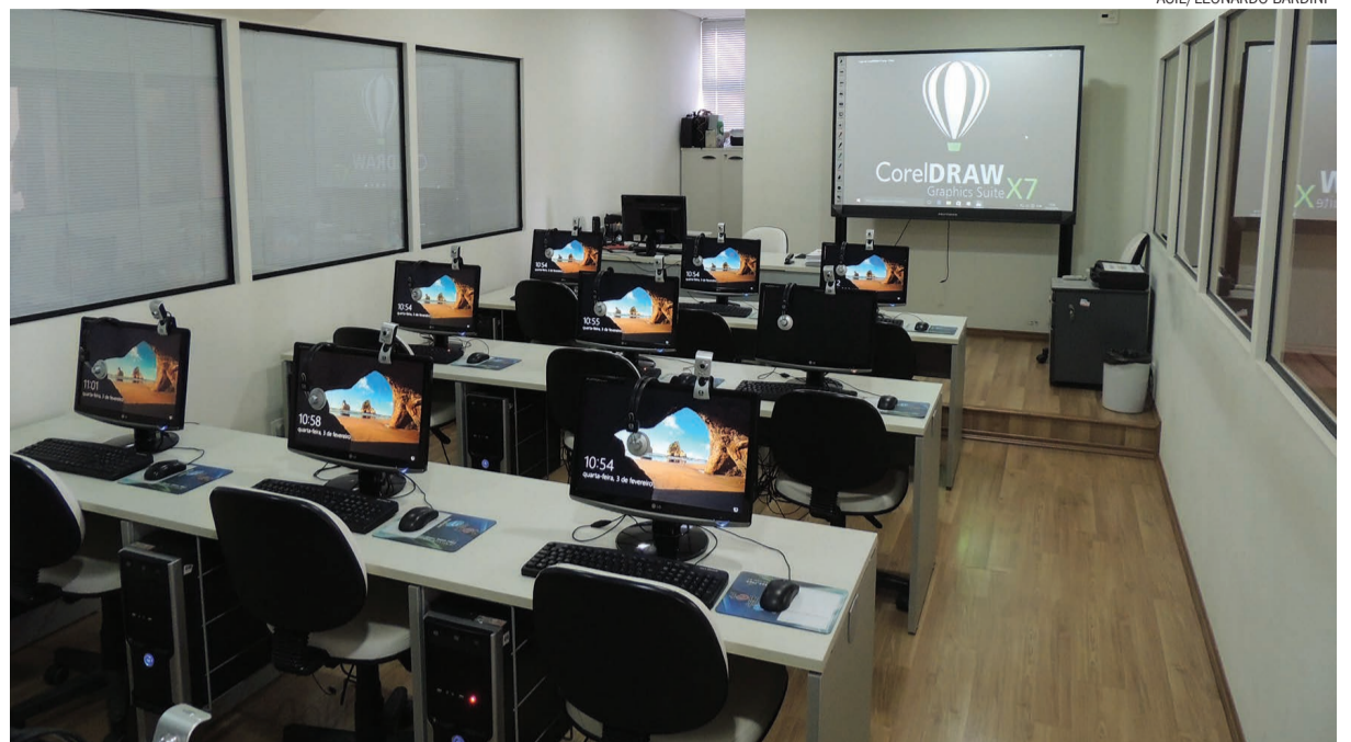
Com um computador por aluno, as aulas serão ministradas no período noturno na ACIL

Além dos novos cursos, o programa de “Introdução à informática” permanece disponível, agora com o uso do