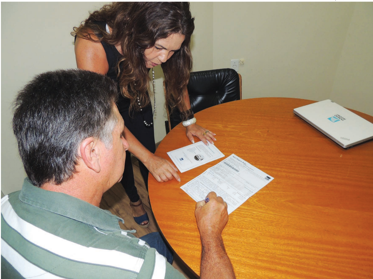
É importante escolher uma corretora de seguros de confiança na hora de fechar um contrato, para que não haja futuras complicações